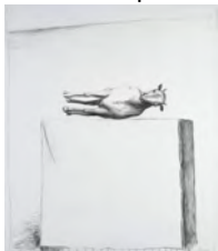
Immagine di Lino Frongia

Pilade è l'opera che crea un prima e un dopo nell'intero corpus poetico pasoliniano.