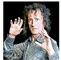
L'attore Antonio Rezza, 57 anni