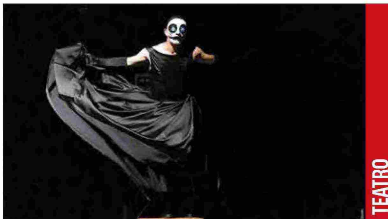
"Antigone" di Anouilh, regia Roberto Latini. Sotto: L'Espresso del 25 febbraio 1990

Maschile e femminile, passato e presente, Sofocle e il nazismo. Latini trasforma il testo di Anouilh in un esame di coscienza collettivo