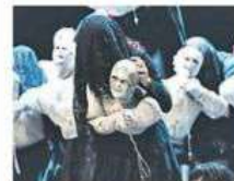
Una scena dello spettacolo

Come si affronta artisticamente il tema della violenza di genere? Quale è il linguaggio più giusto per ingrandire quei dettagli invisibili, trascurati, interiorizzati, che preludono alla tragedia? È la domanda condivisa dall'autrice-regista Valentina Esposito con la sua compagnia formata da attori ex detenuti, oggi professionisti di cinema e teatro. Il frutto di questo affondo corale è Mercoledì delle Ceneri , uno spettacolo magnetico che ci trascina verso una zona lacustre e paludosa, dove sopravvivono riti ancestrali e una intera comunità si compatta attorno ad un segreto: l'omicidio di una giovane donna avvenuto anni prima.