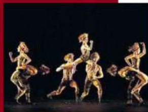
Nelle foto, tre momenti dello spettacolo "Botanica Season 2" dei Momix che Moses Pendleton porta a Roma dal 28 aprile al 10 maggio